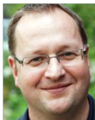
Kai Noster Anzeigenverkauf